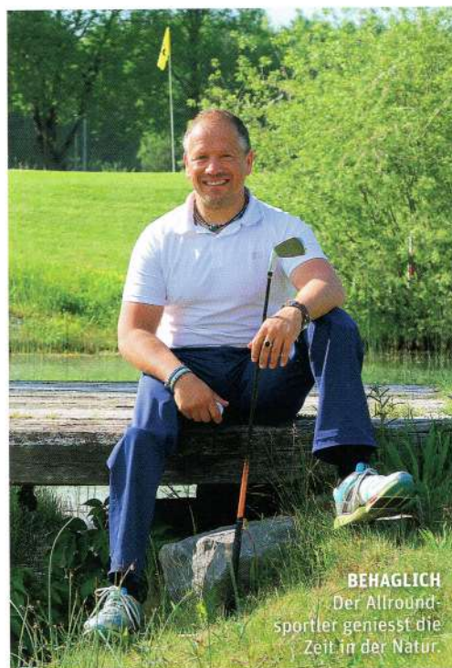
BEHAGLICH Der Allroundsportler geniesst die Zeit in der Natur.