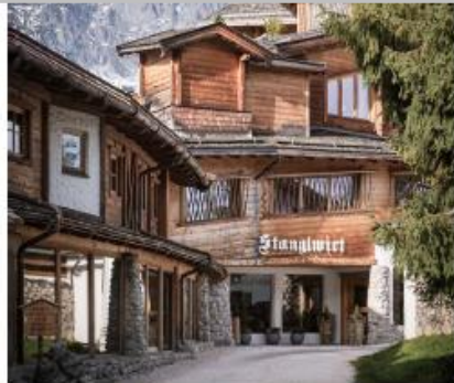
Bio- & Wellnessort Stanglwirt