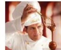
Lindt & Sprüngli Austria