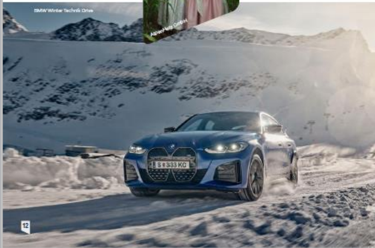
BMW Winter Techrek Drive