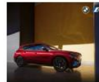
BMW Austria GmbH

uns über die Mitgliedschaft hinaus unterstützen. Dafür bedanken wir uns im Namen aller Mitglieder. Ihr Einsatz ist uns eine besondere Erwähnung und die Markenpräsenz in allen Wirkungsbereichen wert.