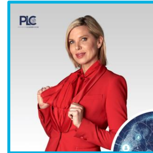
MAJA PRINZESSIN VON HOHENZOLLERN