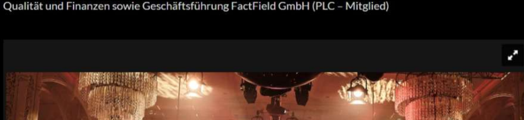
Bild: Deutscher Netzwerk Award - Gala 2025 - Sieger Premium Leaders Club