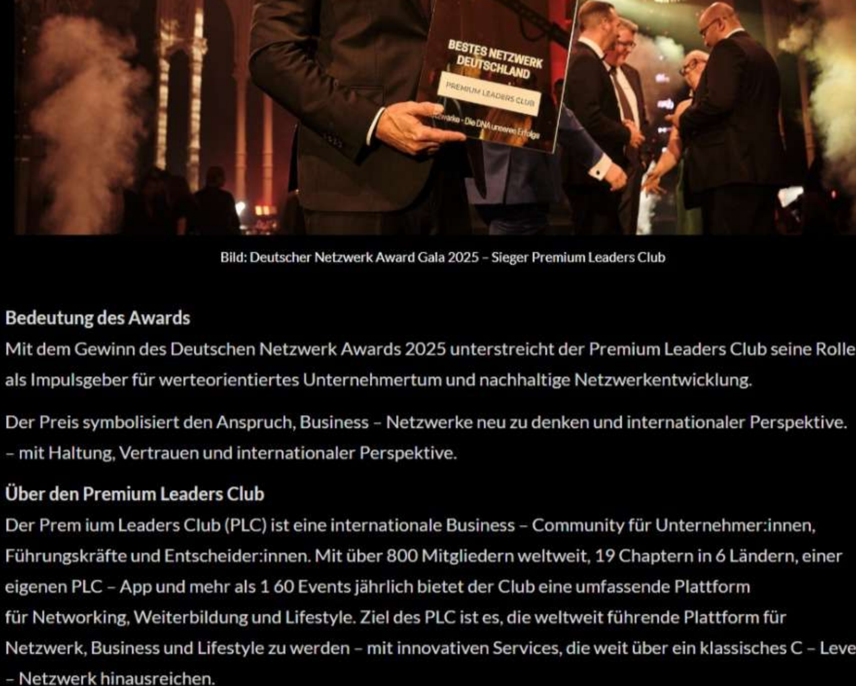
Bild: Deutscher Netzwerk Award Gala 2025 - Sieger Premium Leaders Club

Mit den fünf Säulen Business Network, Premium Events, Leaders Learning, Marketplace und Media schafft der Club ein Ökosystem, das Weiterbildung, Kooperation und Lebensqualität miteinander verbindet. Zum Serviceportfolio gehören neben Masterclasses, Coachings und Business - Formaten auch Concierge Services und exklusive Benefits, die weit über klassische Businessnetzwerke hinausgehen.