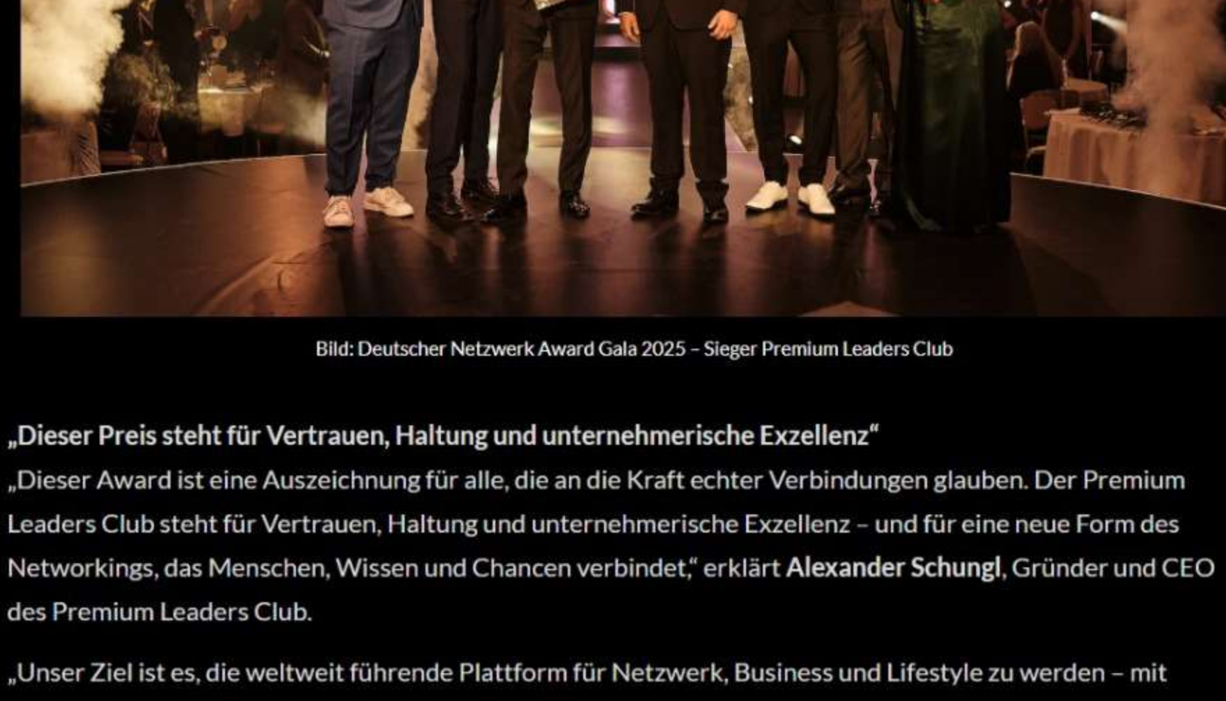
Bild: Deutscher Netzwerk Award Gala 2025 - Sieger Premium Leaders Club

Die Auszeichnung würdigt die konsequente Arbeit des PLC, Unternehmer:innen, Führungskräfte und Visionär:innen über Ländergrenzen hinweg zu verbinden - mit Fokus auf Business, Bildung, Service, Dienstleistungen und Werteorientierung.